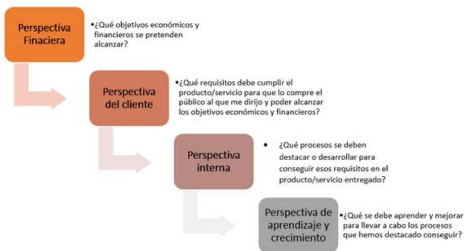
Cuadro 1. Perspectivas para la elaboración de un Cuadro de Mando Integral